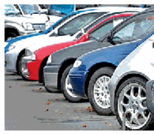
बिक्री पर प्रभाव डाल सकती है पश्चिमी एशिया की स्थिति

नई दिल्ली: प्रोट: देश में मोटर वाहनों की कुल खुदरा बिक्री अप्रैल में 12.94 प्रतिशत बढ़कर रिकार्ड 26,11,317 इकाई रही जबकि पिछले साल की समान अवधि में यह 23,12,221 युनिट थी। उद्योग संगठन 'फेडरेशन आफ आटोमोबाइल डीलर्स एसोसिएशन' (फाडा) ने मंगलवार को कहा कि जीएसटी में कटौती, आरबीआइ द्वारा रेपो रेट में नरमी, मजबूत रबी फसल के बाद ग्रामीणों के हाथ में आए ऐसे जैसे सकात्मक कारकों ने उद्योग को मजबूत प्रदर्शन में मदद की।