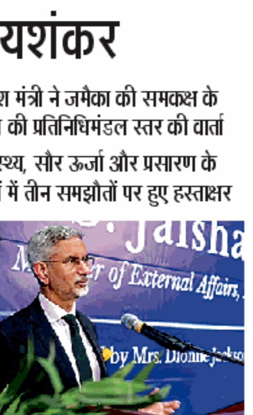
किंगस्टन में मंगलवार को यूनिवर्सिटी आफ वेस्ट इंडीज मोना कैपस में संशोधित करते विदेश मंत्री एस जयशंकर।

विदेश मंत्री ने जमैका की समकक्ष के साथ की प्रतिनिधिमंडल स्तर की वार्ता स्वास्थ्य, सौर ऊर्जा और प्रसारण के क्षेत्रों में तीन समझौतों पर हए हस्ताक्षर