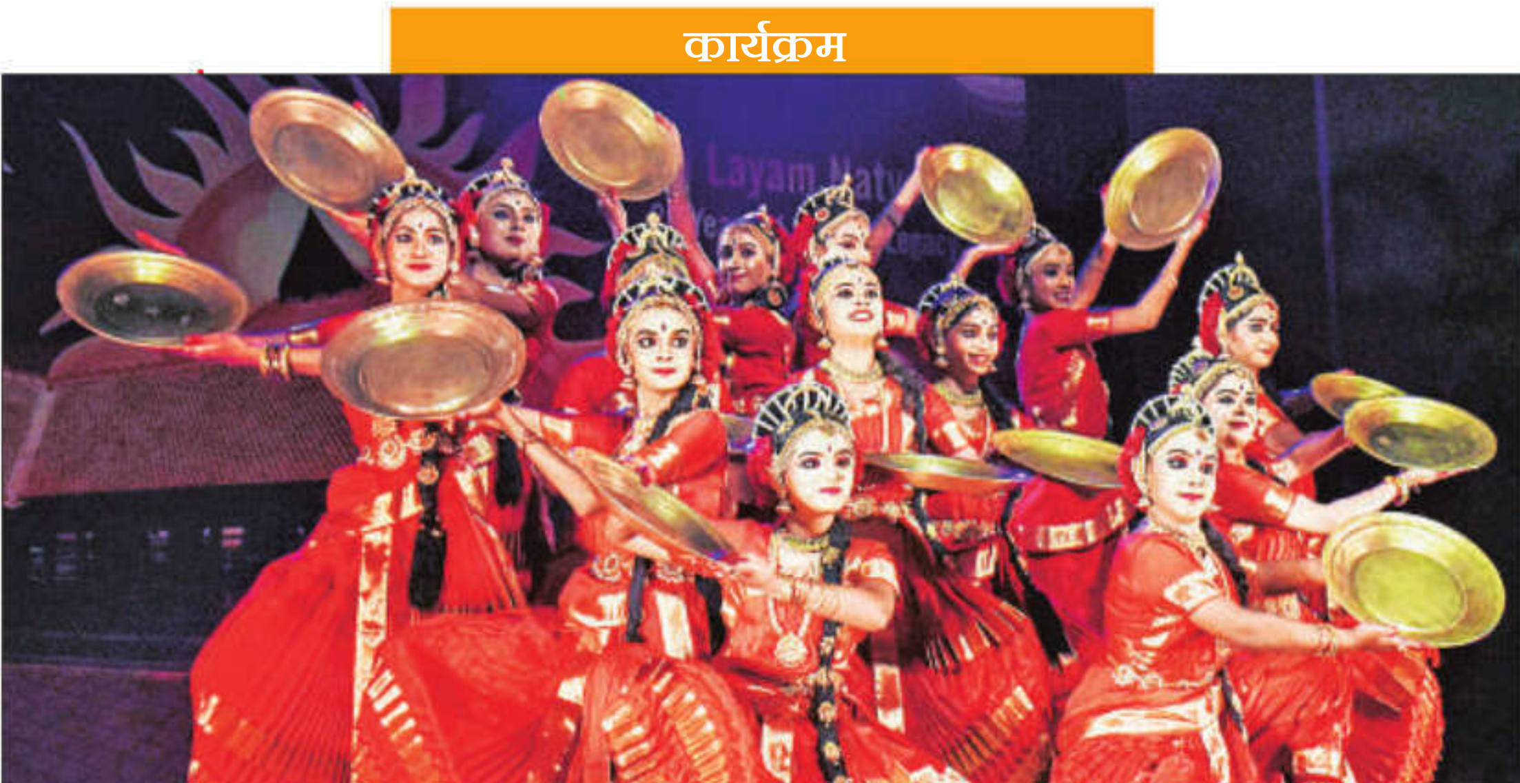
भोपाल के रवींद्र भवन में नृत्योत्सव के दौरान भारतीय शास्त्रीय नृत्य प्रस्तुत करते श्री कला समिति के कलाकार।