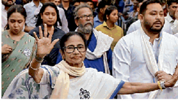
भारी पक्षी मुस्लिम तुष्टीकरण की राजनीति। फाइल

अब वह फ्राड नहीं चलेगा कि मुस्लिम गोलबंदी तो सेक्युलर राजनीति है, मगर हिंदुओं को गोलबंद करणा सांप्रदायिक