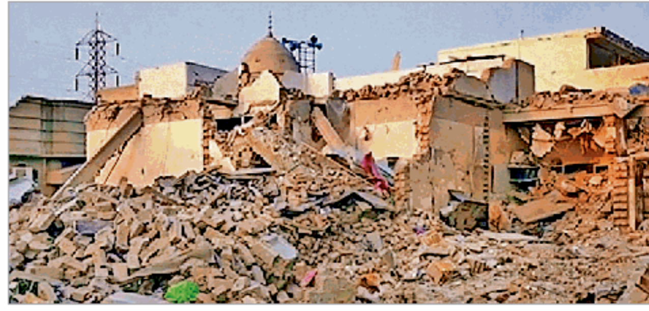
आपरेशन सिंदूर के दौरान पाकिस्तान में ध्वस्त किया गया आतंकी ठिकाना। फाइल

निशाना बनाना पूरी तरह से अस्वीकार्य है, फिर भी यह वैचारिक स्पष्टता उन आतंकी दांचों के खिलाफ निरंतर कार्रवाई में तब्दील हो पाई है, जो ऐसे हमलों को बढ़ावा देते हैं। खासतौर से तब यह और अखरता है, जब ऐसे दांचों का पूरा तंत्र पाकिस्तान में स्पष्टता से दिखाई देता हो और वे कार्रवाई से बचे रह जाएं। पहलगांम आतंकी हमले के सिलसिले में जिन नेटवर्कों की पहचान की गई, वे उसी दांचे का हिस्सा हैं, जो पाकिस्तानी इलाकों में एक सुसंगठित सहायता तंत्र के दायरे में संचालित होते हैं। इसमें प्रशिक्षण सुविधाएं, वित्तीय सहायता, भर्ती के रास्ते और वैचारिक समर्थन जैसे पहलू शामिल हैं। पिछले कई वर्षों में विभिन्न जांचों में इन तत्वों को बार-बार प्रमाणित किया गया है। इसके बावजूद अंतरराष्ट्रीय प्रतिक्रियाओं में पाकिस्तान पर इस बात के लिए निरंतर दबाव बनाने को लेकर व्यापक रूप से परहेज ही किया गया है कि वह इन नेटवर्कों को चिह्नित कर उन्हें ध्वस्त करे। ऐसे दांचों को चिह्नित कर उन पर कार्रवाई के मोर्चे पर अंतर को खाई निरंतर चौड़ी होती जा रही है और उसमें एक चिरपरिचित रूढ़ान भी नजर आता है। प्रत्येक बड़े आतंकी हमले के बाद कड़ी कूटनीतिक प्रतिक्रिया सामने आती है। उसके बाद