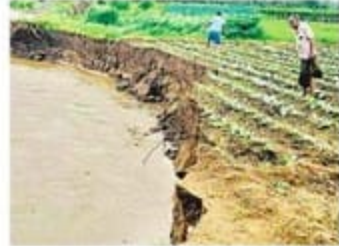
नदियों के सिक्कुड़ने के पीछे मूल वजह अनियोजित भूमि उपयोग के साथ जलधाराओं के किनारे होने वाली रासायनिक खेती है।