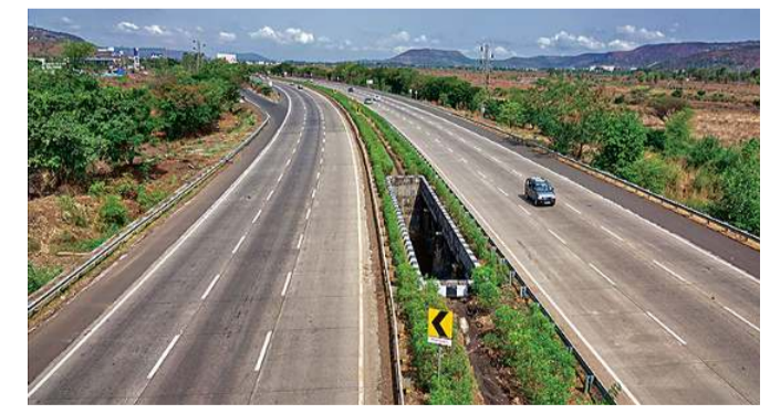
2014 से देश में 3.75 लाख किमी लंबी नई सड़कों और हाईवे का किया गया निर्माण। फाइल

योजना के तहत पात्र हितग्राही महिलाओं को एक हजार रुपये प्रति माह देकर महिला सशक्तीकरण का नया अध्याय लिखा जा रहा है। आंतरिक सुरक्षा के क्षेत्र में नक्सलवाद के विरुद्ध लड़ाई इस कालखंड की बड़ी उपलब्धियों में से एक है। वर्षों तक देश के अनेक आदिवासी क्षेत्र नक्सली हिंसा, भय और पिछड़ेपन के चक्र में फंसे रहे। प्रधानमंत्री के साहसिक नेतृत्व और केंद्रीय गृह मंत्री अमित शाह की सफल रणनीति के अनुसार डबल इंजन की सरकार में नक्सलवाद की जड़ों पर निर्णायक प्रहार हुआ। बस्तर, जिसे की कमी नक्सल हिंसा के कारण जाना जाता था, आज विकास, विश्वास और बदलाव की नई पहचान बना रहा है। 31 मार्च, 2026 तक माओवाद को समाप्त करने का संकल्प सरकार ने पूरा किया। जिन क्षेत्रों में कभी भय था, वहां अब स्कूल, सड़क, स्वास्थ्य सुविधा,