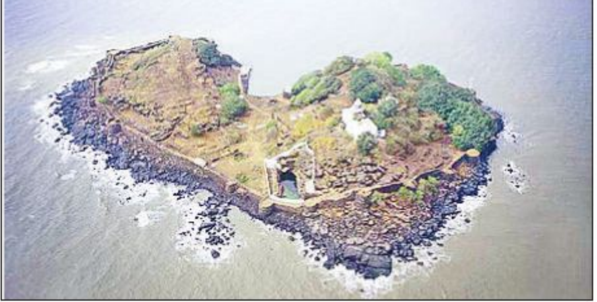
अरब सागर के पानी से घिरा हुआ कोलाबा किला या अलीबाग फोर्ट अलीबाग का एक प्रसिद्ध पर्यटक स्थल और महाराष्ट्र का प्रमुख किला है। महाराष्ट्र के प्रसिद्ध किले में शामिल कोलाबा फोर्ट एक 300 साल पुराना किला है, जो कभी शिवाजी महाराज के शासन के दौरान मुख्य नौसेना स्टेशन था।