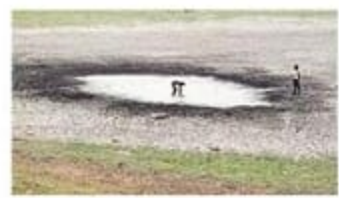
पिछले 50 वर्षों में गंगा नदी बेसिन की करीब 18 लाख छोटी जलधाराएं पूर्णतः विलीन हो चुकी हैं। हम हर दिन औसतन 99 प्राकृतिक जलधाराओं को स्थायी रूप से खो रहे हैं।