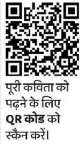
पूरी कविता को पढ़ने के लिए QR कोड को स्कैन करें।