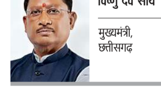
विणु देव साय मुख्यमंत्री, छत्तीसगढ़