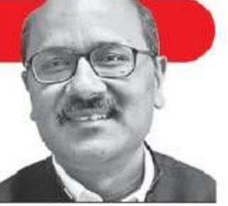
शेखर गुप्ता एडिटर-इन-चीफ, 'द प्रिंट' @ShekharGupta

वह क्या चीज है, जो ब्रांड इंडिया को नुकसान पहुंचा रही है? तीन दशक पहले आर्थिक सुधारों के बाद भारत विकसित देशों की नजरों में एक पसंदीदा देश बन गया था, लेकिन अम हलात क्यों बदल गए हैं? निवेशक पैसा निकालकर जा रहे हैं और भारत आने वाले विदेशी पर्यटकों की संख्या अभी तक वर्ष 2019 के स्तर तक नहीं पहुंच पाई है। मैं समझने की कोशिश कर रहा था कि इसकी वजह क्या है, लेकिन हाल ही में दिल्ली के एक अवैध होटल में लगी आग ने मुझे जवाब दे दिया।