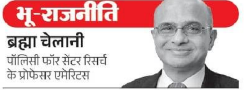
भू-राजनीति ब्रह्मा चेलानी पॉलिसी फॉर सेंटर रिसर्च के प्रोफेसर एमेरिटस

भारत की अपनी हलिया यात्रा के दौरान अमेरिकी विदेश मंत्री मार्को रूबियो ने भारत को अमेरिका के सबसे महत्वपूर्ण रणनीतिक साझेदारों में से एक बताया, लेकिन साझेदारी की यह परिचित भाषा अब दिन-ब-दिन खोखली लगती जा रही है। ट्रम्प के बयानों और टैरिफों के भारत-अमेरिका संबंधों पर पड़े प्रभावों के बारे में बहुत कुछ कहा गया है। लेकिन द्विपक्षीय संबंध ट्रम्प के व्हाइट हाउस में लौटने से बहुत पहले से ही दबाव में थे। हाल के वर्षों में, जैसे-जैसे चीन के बढ़ते रणनीतिक दायरे से भारत की क्षेत्रीय स्थिति कमजोर हुई है, वहीं अमेरिका ने भी दक्षिण एशिया क्षेत्र में ऐसी नीतियां अपनाई हैं, जिन्होंने भारतीय हितों को नजरअंदाज किया है- और कभी-कभी तो वे सीधे तौर पर उनके विपरीत रही हैं।