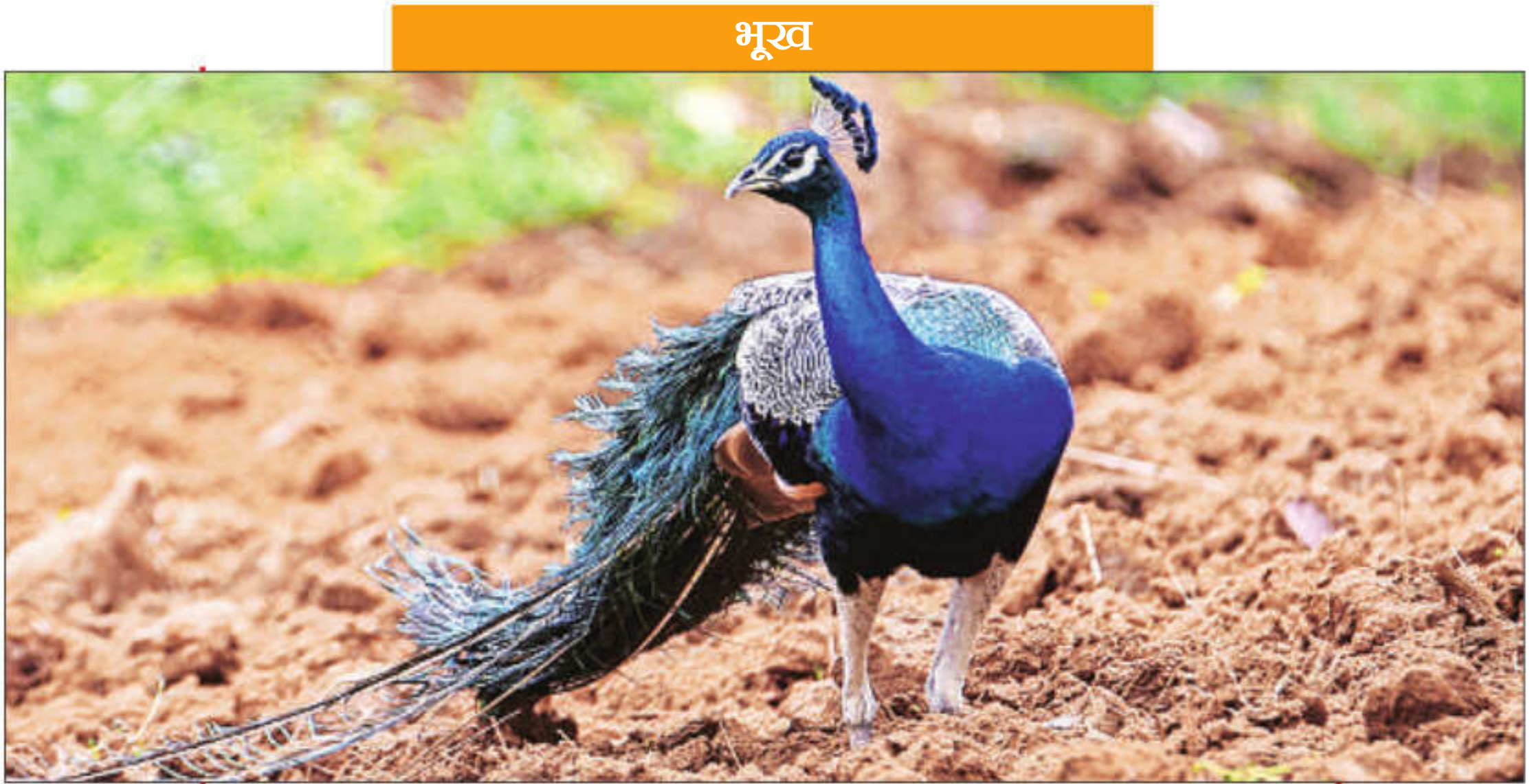
कर्नाटक के सागनीपुरा गांव में मंगलवार को एक खेत में भोजन की तलाश करता हुआ मोर।

स्मार्ट बार्डर बनाने की दिशा में हम आगे बढ़ेंगे। इस योजना को लागू करने के लिए केंद्र सरकार जिला दंडाधिकारी, पुलिस, जनप्रतिनिधियों की मदद लेगी।