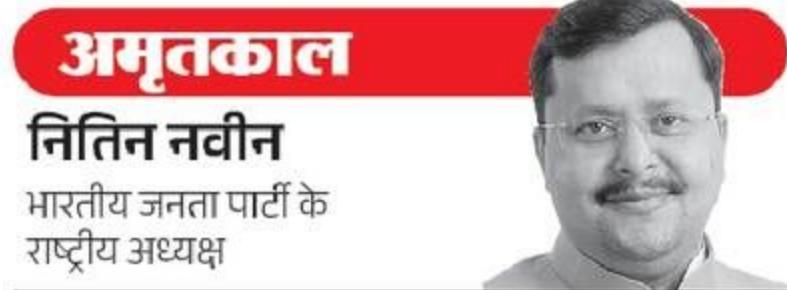
अमृतकाल नितिन नवीन भारतीय जनता पार्टी के राष्ट्रीय अध्यक्ष

प्रधानमंत्री नरेंद्र मोदी के नेतृत्व में केंद्र सरकार ने विश्वास, विकास और जनकल्याण को समर्पित अपने 12 वर्ष पूर्ण किए हैं। 'संकल्प से सिद्धि' का यह गौरवशाली कालखंड भारत के विकास, सुरक्षा, आर्थिक सशक्तिकरण और वैश्विक प्रतिष्ठा में अभूतपूर्व वृद्धि का साक्षी रहा है। कांग्रेस देश को अनिश्चितता, भ्रष्टाचार और कमजोर नेतृत्व को विरासत देकर गई थी, प्रधानमंत्री मोदी ने भारत को आत्मविश्वास, सुरक्षा और विकास का नई पहचान दी है। कांग्रेस के लिए राजनीति का मतलब वर्षों तक परिवार की विरासत को बचाना रहा, जबकि प्रधानमंत्री मोदी के लिए राजनीति 'परिवार नहीं राष्ट्र प्रथम' और 'सत्ता नहीं सेवा प्रथम' का मार्ग रही है।