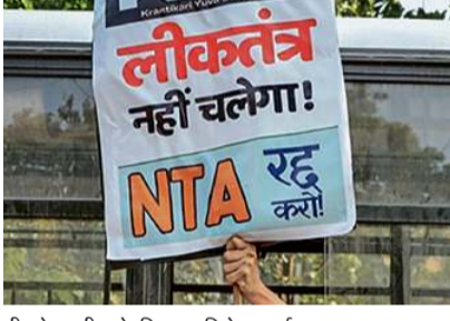
नीट पेपर लीक के खिलाफ विरोध प्रदर्शन। फाइल

किसी बड़ी गलती-गड़बड़ी या दुर्घटना के लिए जिम्मेदार लोगों के खिलाफ कुछ न होना जन मातानाओं की अन्देखी है