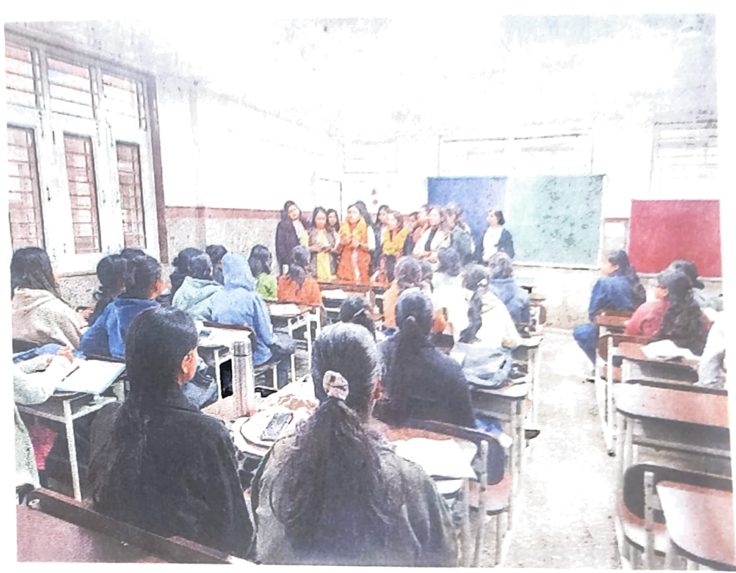
विद्यार्थियों की समस्याओं को सुनते दिल्ली विश्वविद्यालय छात्रसंघ के पदाधिकारी 🌞 सौ. इसू

दिल्ली ः दिल्ली नर्ड जासं. विश्वविद्यालय (डीयू) के विद्यार्थियों की समस्याओं को जानने व उनकी समस्याओं का समाधान करने के लिए दिल्ली विश्वविद्यालय छात्रसंघ (डूसू) के पदाधिकारियों ने डूसू इन कैंपस अभियान शुरू किया है। इस अभियान के अंतर्गत तीन समूहों में डूसू के पदाधिकारी हंसराज कालेज, किरोड़ीमल कालेज, रामजस कालेज, शिवाजी कालेज, राजधानी कालेज, लक्ष्मीबाई कालेज, श्री अरबिंदो कालेज, कालेज फार वोकेशनल स्टडीज में जाकर विद्यार्थियों से मिले और उनकी समस्याओं का समाधान निकालने का प्रयास किया। पदाधिकारियों ने कालेज परिसर सक्रियता के बारे में और इस् की वर्तमान योजनाओं से विद्यार्थियों को अवगत कराया। विद्यार्थियों से संवाद के बाद इसू ने अलग-अलग कालेजों के प्राचार्यों को ज्ञापन देकर कालेज की विभिन्न