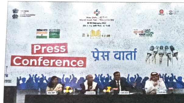
Union Minister for Education Dharmendra Pradhan will inaugurate the World Book Fair 2024 on February 10. This was announced at a press conference in New Delhi by Yuvraj Malik, Director, National Book Trust

"India has a rich diversity of languages. In Schedule 8,